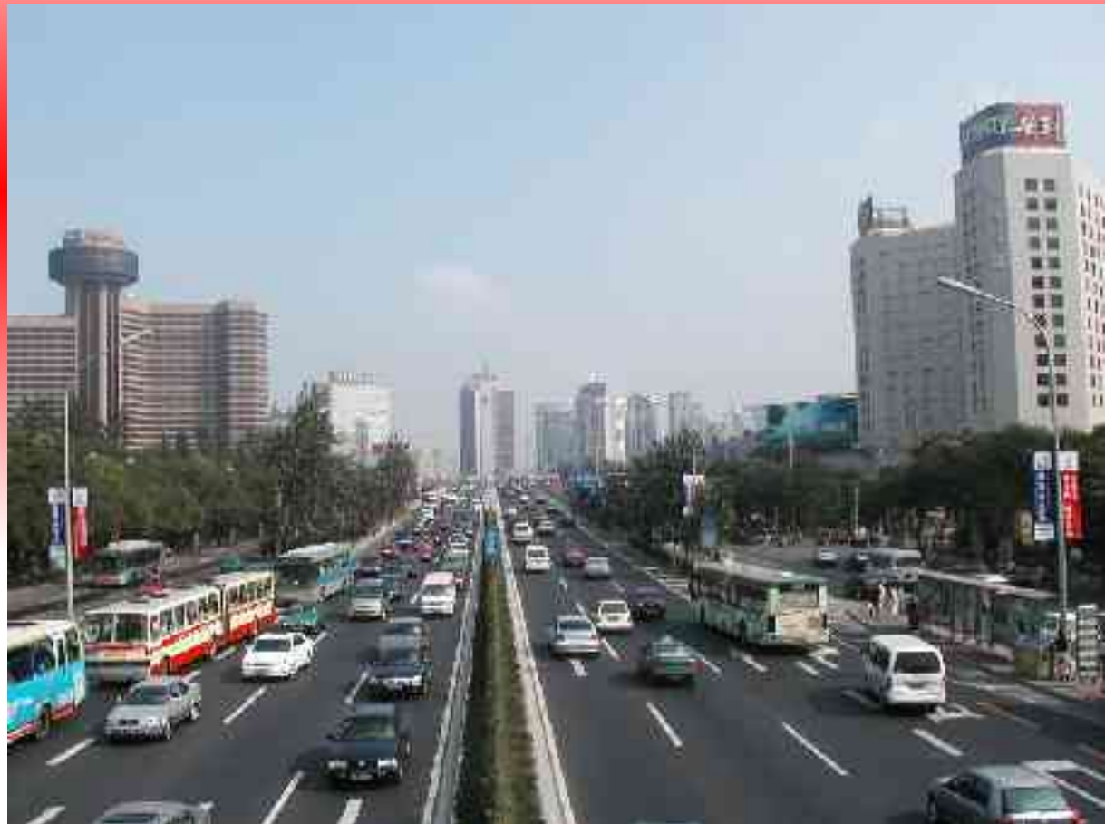
Périphérique à Pékin.

Elle attire des flux de main-d'œuvre, de marchandises ou de capitaux.